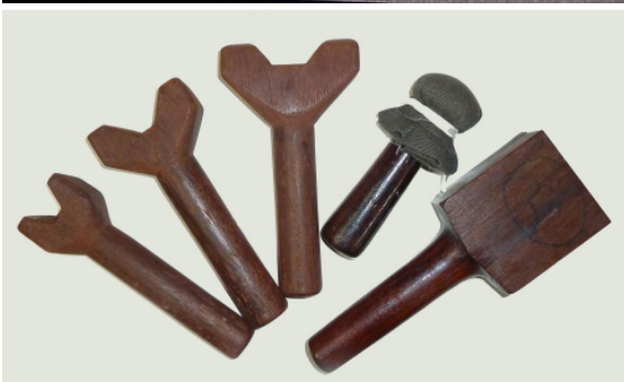
トークセンで使われる器具